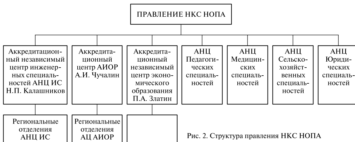
Рис. 2. Структура правления НКС НОПА